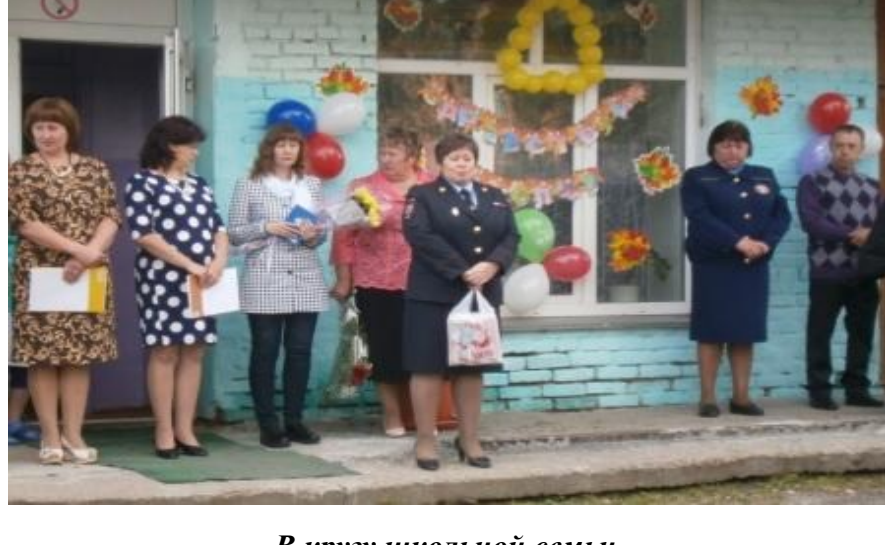
В кругу школьной семьи