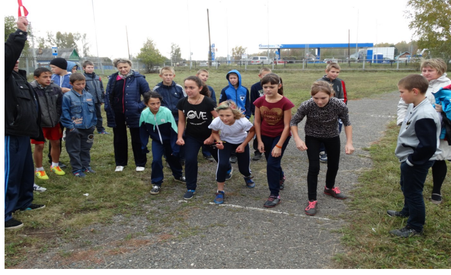
Участники кросса «Золотая осень»